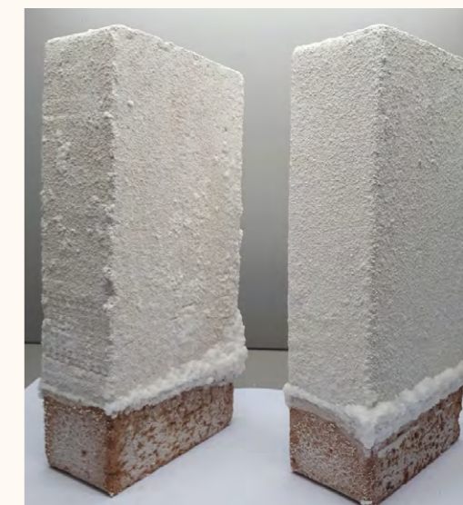
1 mano / 2 mani

PRYMER24 INIBISCE LA COMPARSA DELLE EFFLORESCENZE, IN MANIERA ANCORA PIÙ SIGNIFICATIVA SE APPLICATO A 2 MANI