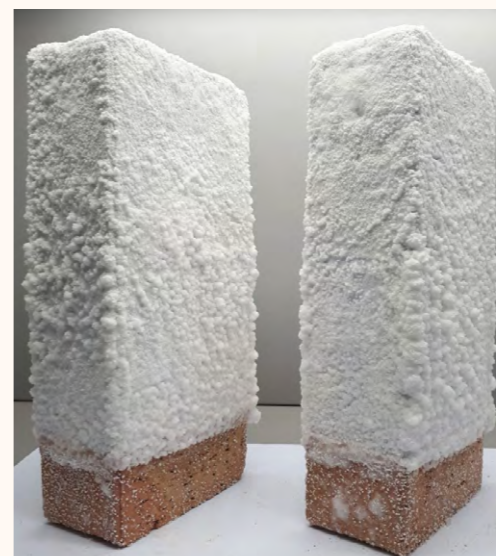
1 mano / 2 mani